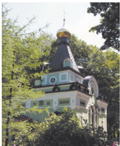
Часовня Блаженной Ксении на Смоленском кладбище в Санкт-Петербурге

До сих пор почтовый ящик в часовне на Смоленском кладбище, в котором паломники со всей России оставляют записки с просьбами и благодарностями, не пустует: верующие знают, как быстро блаженная Ксения откликается на их молитвенные обращения. ✝.