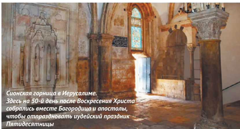
Сионская горница в Иерусалиме. Здесь на 50-й день после Воскресения Христа собрались вместе Богородица и апостолы, чтобы отпраздновать иудейский праздник Пятидесятницы