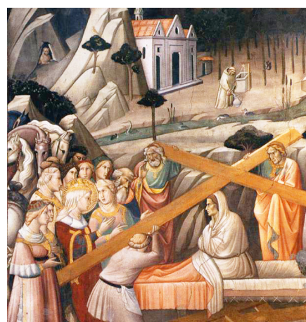
Художник Аньоло Гадди. Фреска из храма Креста Господня, Флоренция, XIV век. Фрагмент

Спаси, Господи, людей Твоих и благослови удел Твой, победы (православным христианам) над неприятелями даруя и Крестом Твоим сохраняя народ Твой.