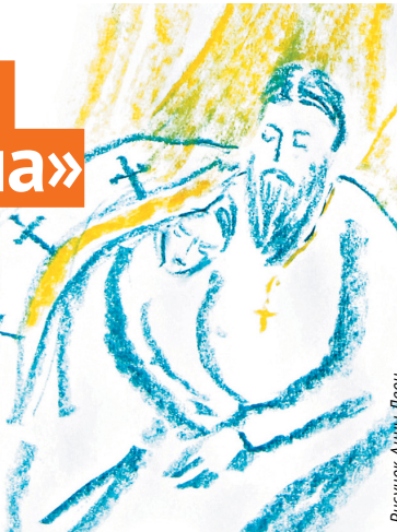
Рисунок Анны Лео

Я накрыл ее епитрахилью, она взяла меня за руку. Когда я прочитал над ней молитву разрешения от грехов, она крепко сжала ее. Приняв Причастие, она как-то