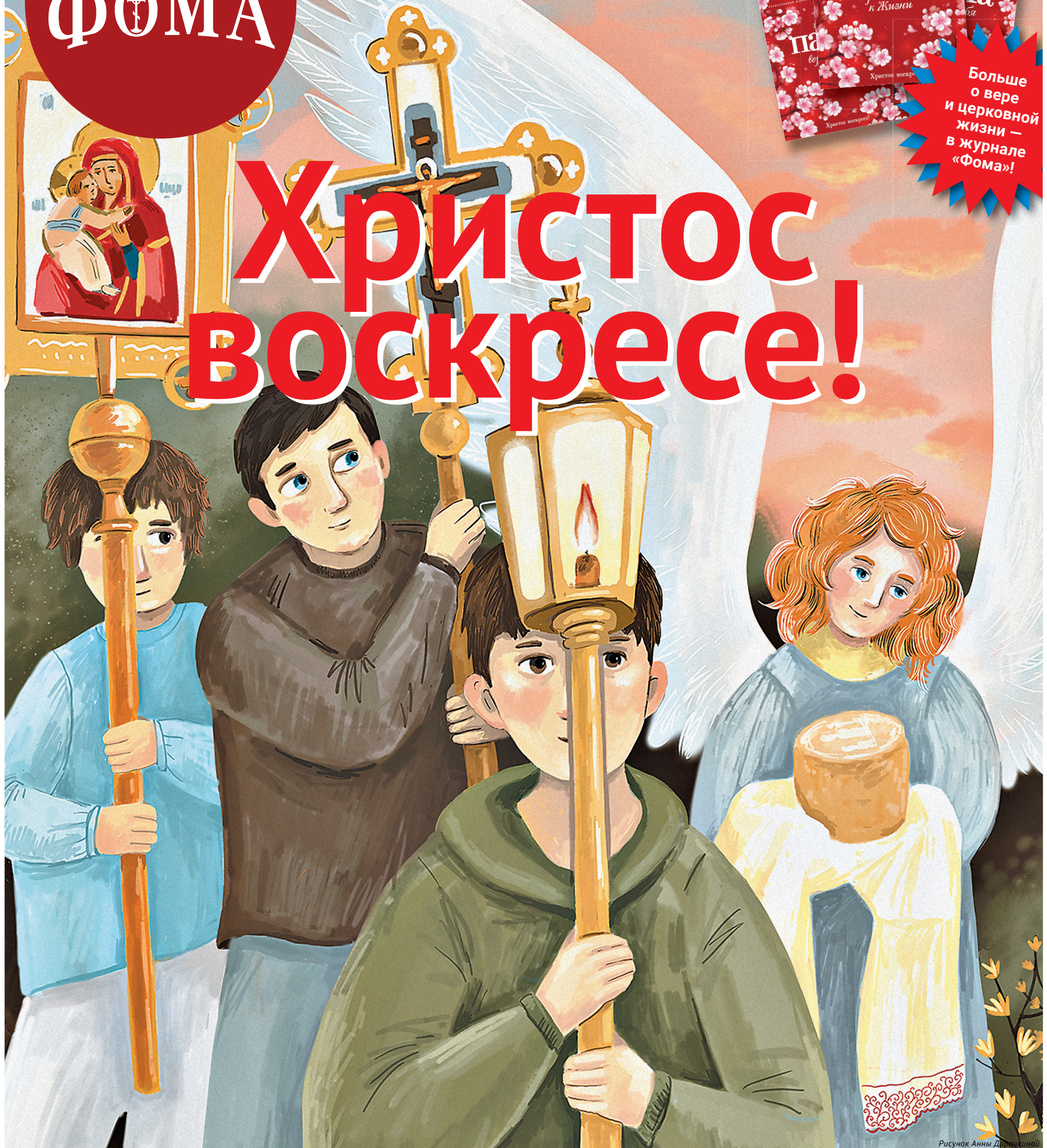
Рисунок Анны Доронкиной