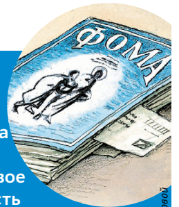
Рисунок Натальи Кондратовой

В 1996 году вышел первый номер журнала «Фома», получивший свое название в честь апостола, жаждущего найти истину и получившего уверение от Христа. Присоединяйтесь! Подписывайтесь на «Фому»! ←