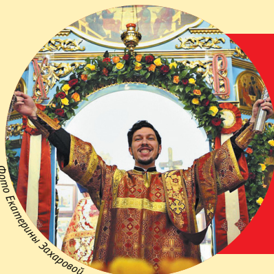
Фото Екатерина Захаровой